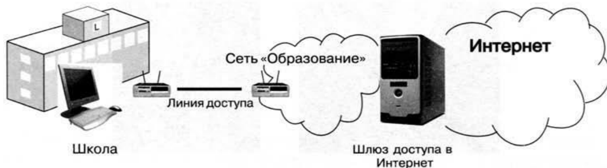
Рис. 4.2. Схема подключения школ к Интернету

Наиболее известной и самой обширной глобальной компьютерной сетью является Интернет . Эта сеть объединяет многочисленные ло-